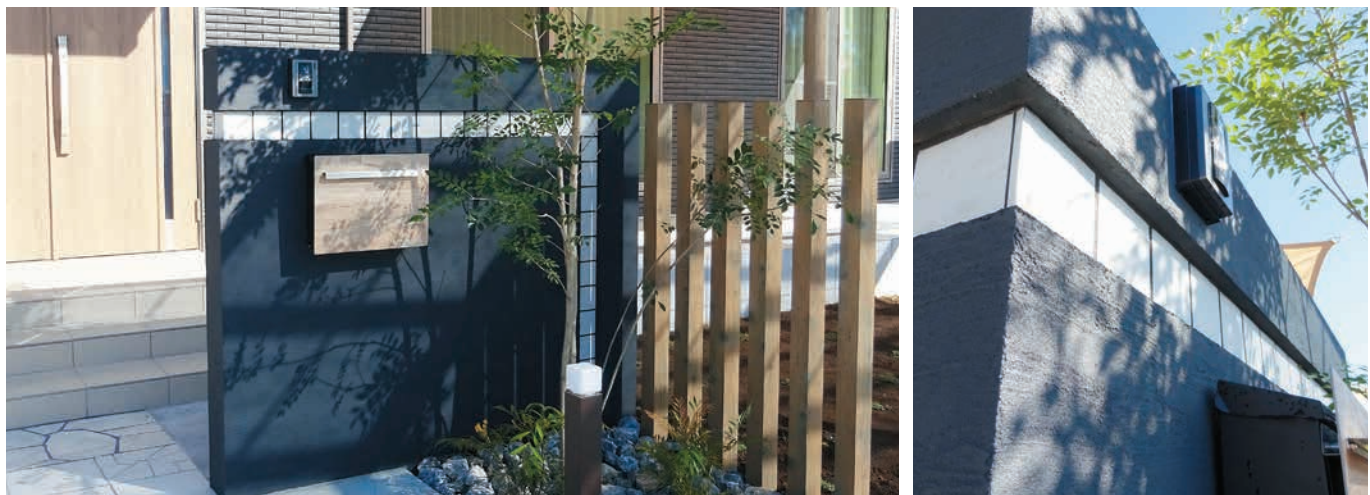
※画像はスマートF-ウォールです。